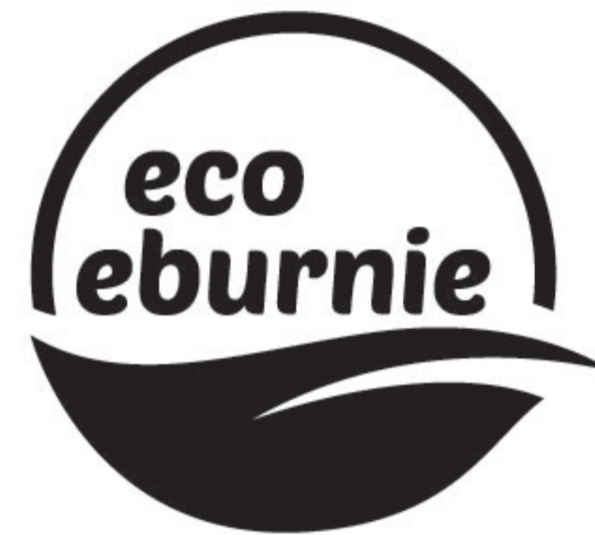
version positive monochrome