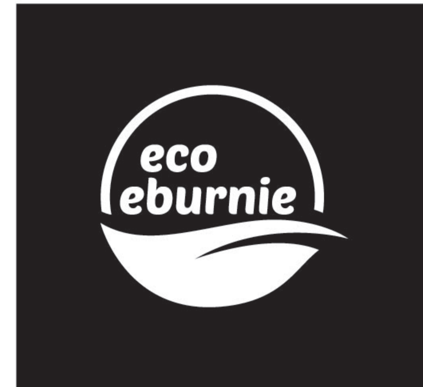
version négative monochrome